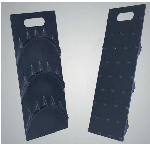
Her ses produktet Free Grip.